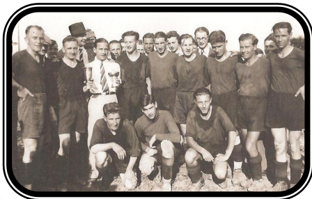
Abschlusstabelle 1. Liga Gruppe Ost, Saison 33/34: