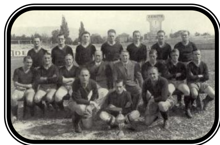
Die vom FCK besiegte Meistermannschaft von Servette Genf.

Doch die beste Leistung zeigten die Kreuzlinger im Flutlichtspiel gegen Servette Genf , dem amtierenden Schweizer Meister. Vor 3'000 Zuschauern, darunter wiederum vielen Konstanzern und auch vielen Fussballfans aus den angrenzenden Kantonen, gewann der FC Kreuzlingen sensationell mit 3:2.