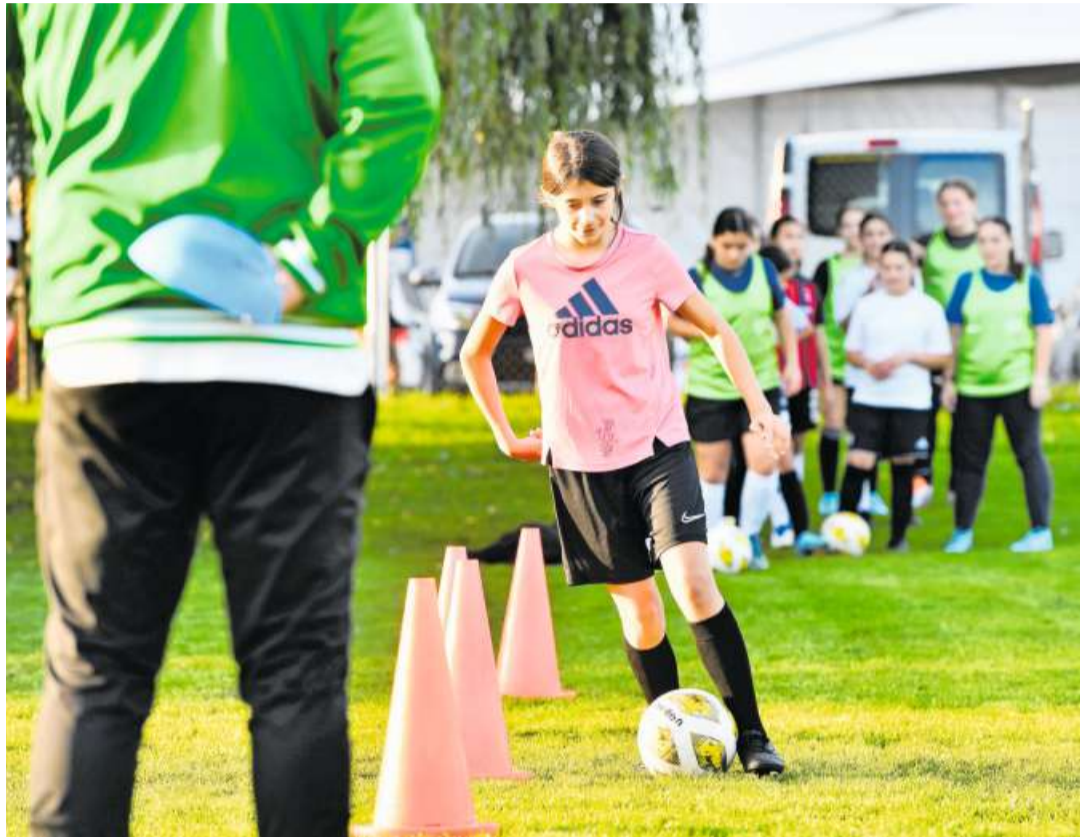
Fussballtraining erfreut sich bei den Kreuzlinger Mädchen steigender Beliebtheit.